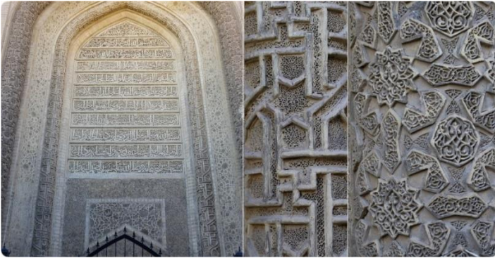
Mustansiriyye Medresesi taç kapısı, kitabesi ve bazı tezyinat detayları.