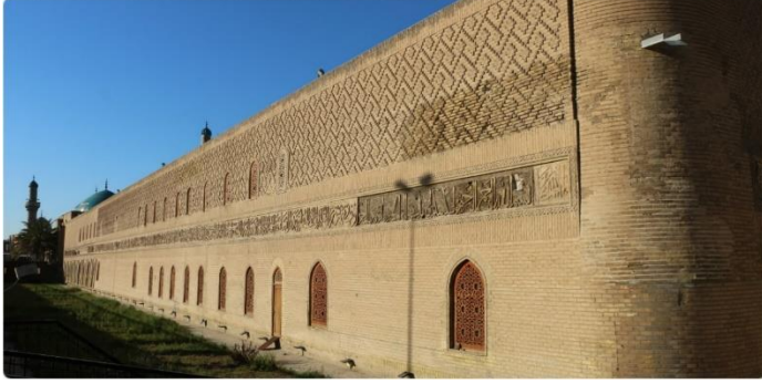
Mustansiriyye Medresesi'nin avlusu ve Dicle tarafından görünüşü.